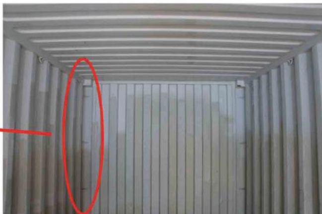
7-2, Venstre side